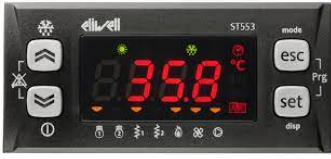
Eliwell microprocessor controller.